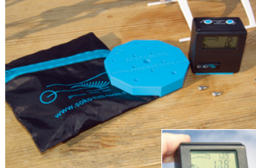
Zum Lieferumfang des Soko Kits gehört die Kunststoff-Befestigungsplatte Helical, das Winkelmessgerät Soko Gauge inklusive zwei Batterien sowie eine Tasche und Befestigungsmaterial