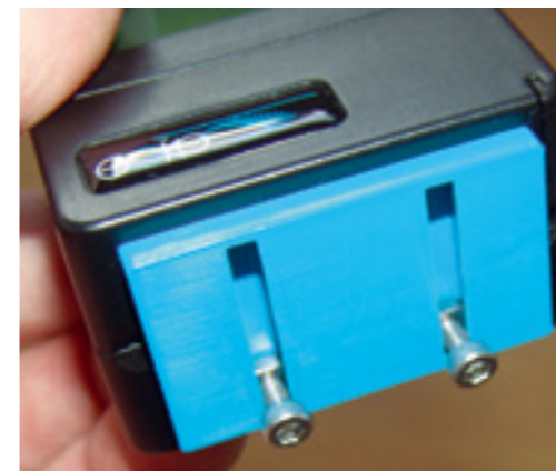
Die Befestigung der Gauge auf dem Helical erfolgt mittel dieser bereits am Boden montierten Adapterplatte und Schraubverbindungen. Wer auf das Gefummel mit den Muttern verzichten möchte, kann zur Befestigung alternativ auch das beiliegende Klettband verwenden

gesagt, dass dieses Kompendium Bestnote verdient. Nur selten haben wir so etwas Ausführliches und Detailliertes gesehen. Vor allem aber ist es logisch und leicht verständlich aufgebaut – da war man bei der konzeptionellen Erstellung mit sehr viel Verstand und Herzblut bei der Sache. Deswegen sparen wir uns an dieser Stelle eine detaillierte Beschreibung aller Details beim Mess-Prozedere, da es ausführlich in der Anleitung erläutert wird.