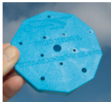
Das Helical ist eine Montageplattform zur Aufnahme des Winkelmessgeräts. Fünf unterschiedliche Randstärken des Zehnecks und definiert angebrachte Befestigungsbohrungen sorgen dafür, dass man es in alle gängigen Blatthalter montieren kann

Bevor es jedoch mit dem Messen los geht, sollte man sich der ausführlichen deutschen Anleitung widmen, die zum Zeitpunkt unserer Erprobung in der Version 2.1 vorlag und auch im Internet bei Soko Tool heruntergeladen werden kann. Hierzu sei