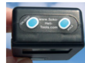
Mit kurzem Drücken auf ON/ZERO lässt sich das Gerät auf Null zurücksetzen, mit langem Tastendruck kann man das Gerät ein-beziehungsweise ausschalten. Die Taste HOLD speichert den aktuellen Anzeigewert