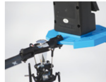
Ganz einfach: Statt des Rotorblatts wird die mit Winkelmessgerät versehene Helical im Blatthalter montiert. Zum lotrechten Ausrichten des Helis montiert man die Platte anstelle der Rotorbremse

Das dem Kit beiliegende Soko Helical ist eine vielseitig Montageplattform aus Kunststoff zur Aufnahme des Winkelmessgeräts. Es wird mit der entsprechend passenden Seite anstelle des Rotorblatts im Hauptrotor-Blatthalter montiert. Vielseitig bedeutet in diesem Fall konkret, dass das Helical für alle Heli-Größen und -Marken geeignet ist. Denn es gibt fünf unterschiedliche Randstärken des Zehnecks, um 3, 4,5, 10, 12 und 14 Millimeter starke Blatthalter-Aufnahmen bedienen zu können. Eventuelle Zwischenabmessungen lassen sich mit den jeweiligen Rotorblatt-Passscheiben adaptieren. Die Bohrungen für die