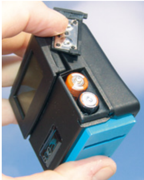
Herkömmliche AAA-Batterien versorgen das Präzisionsinstrument mit Strom

Blatt-Befestigungsschrauben (Gewinde M2 bis M5) sind an die üblichen Maße angepasst.