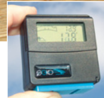
Das Display hat zwei Anzeigebereiche. Im oberen wird der absolute Winkel (Wasserwaage) angezeigt, im unteren der relative Winkel zum zuletzt eingestellten Nullpunkt