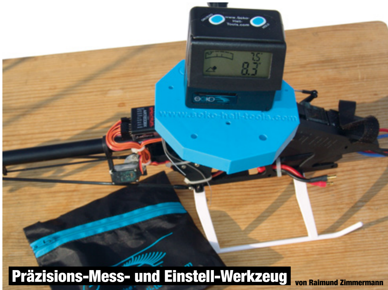
Präzisions-Mess- und Einstell-Werkzeug von Raimund Zimmermann